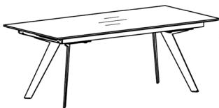
Abbildung in Standardausführung ohne Auszug

Querschnitt der Tischplatte, mit Schweizer Kante MDF 2,3 cm dick