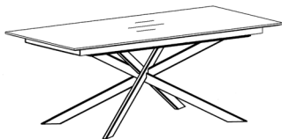
Abbildung in Standardausführung ohne Auszug

Querschnitt der Tischplatte, mit Schweizer Kante MDF 2,3 cm dick