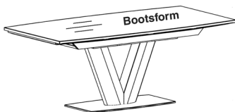
Abbildung in Standardausführung ohne Auszug

Querschnitt der Tischplatte, mit Schweizer Kante MDF 2,3 cm dick