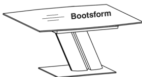
Abbildung in Standardausführung ohne Auszüge

Querschnitt der Tischplatte, mit Schweizer Kante MDF 2,3 cm dick